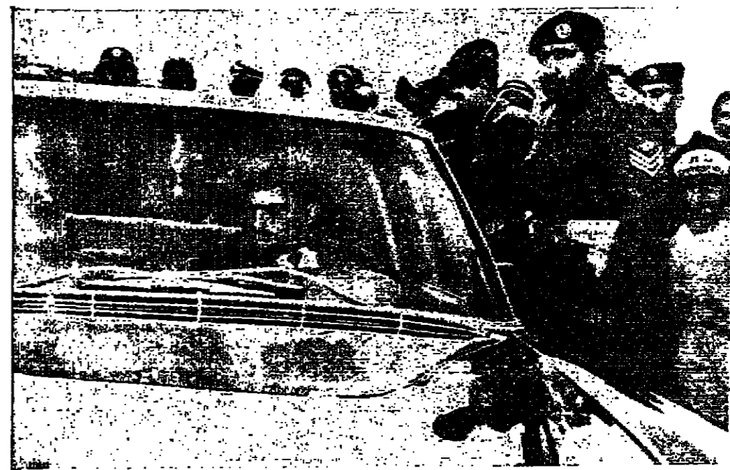
مو الخير حسن ولي العهد العظيم يودع نهارته اثناء زيارته لخصيمات القزحين

عمان - دعا المهرجان الذي اقيم في قاعة نقابة المحامين امس الى حماية المدينة المقدسة من اخطار التهويد وشجب الاجراءات التي تتخذها اسرائيل لضم المدينة اليها ، كما دعا الى ارتفاع الدول والشعوب العربية والاسلامية الى مستوى المراكز وتعبئة الجماهير لتحرير فلسطين ومجابهة الضغوط التي يتعرض لها المواطنون في القدس من جراء تطبيق القوانين الاسرائيلية التي تم بوجوبها الغاء التشريعات الاردنية بالاضافة الى تغيير معالم القدس والامكن الدينية ومصادرة الاراضي العربية فيها